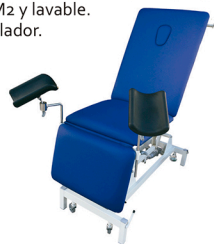
ECOMAX-GINECOLOGICA: OPCION PERNERAS:+REF.MM-JP

VER MAS VARIANTES Y ACCESORIOS PAG. 28, EN TARIFA ó CONSULTAR