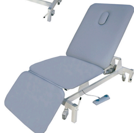
Ref. MM-ECOMAX-3E Cod 4038