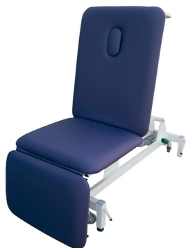
Ref. MM-ECOMAX-3H - Cod 4037